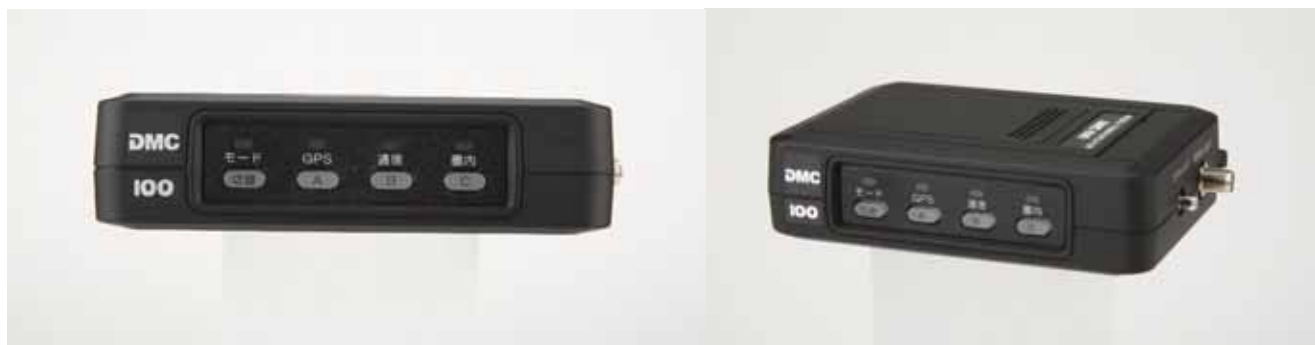
FOMA 対応 車載端末「モバイルコミュニケーター DMC-100」 (日米電子株式会社製)